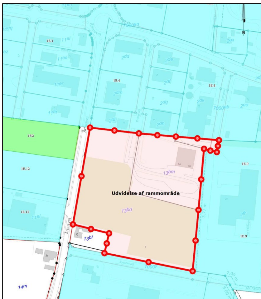
Kort med markering af udvidelse af rammeområde 1.E.4.

Der er i forbindelse med den offentlige høring til Forslag til Kommuneplan 2025 indkommet høringssvar om udvidelse af rammeområde til erhverv på 13bm, del af 13bd samt del af 2dk Auning By, Auning, så etablering af et nyt hovedkontor til virksomheden JS-Byg Aps kan muliggøres.